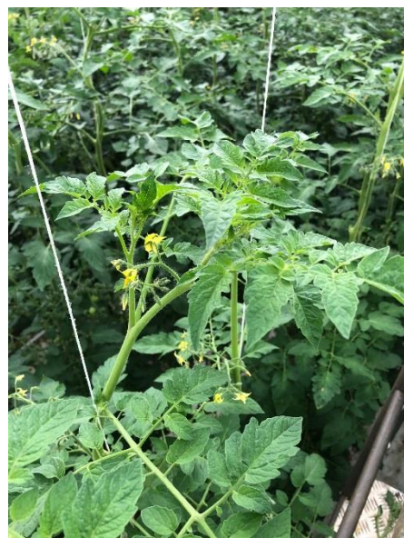
写真3 ミニトマトの成長点の様子