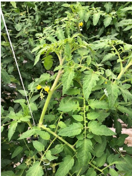
写真2 大玉トマトの成長点の様子